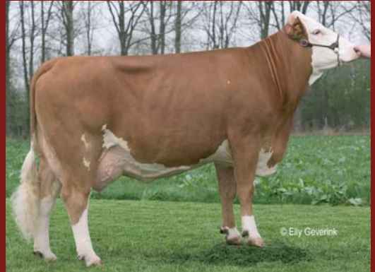
2e generatie FLxHL kruisling

Naast de productie kenmerken waren voor ons vooral de kenmerken uier, karakter en melksnelheid belangrijk. Over het karakter kunnen we maar een ding melden en dat is ronduit geweldig. De uiers zijn duidelijk anders gevormd dan bij de Holstein, de vooruieraanhechting en achteruierhoogte zijn minder extreem, de ophangband is juist wel zeer duidelijk zichtbaar. De uiers laten zich zeer goed leegmelken en de apparaten hangen er zeer goed onder. Al met al zijn de uiers met veel klierweefsel zeer duurzaam maar hebben geen showallure.