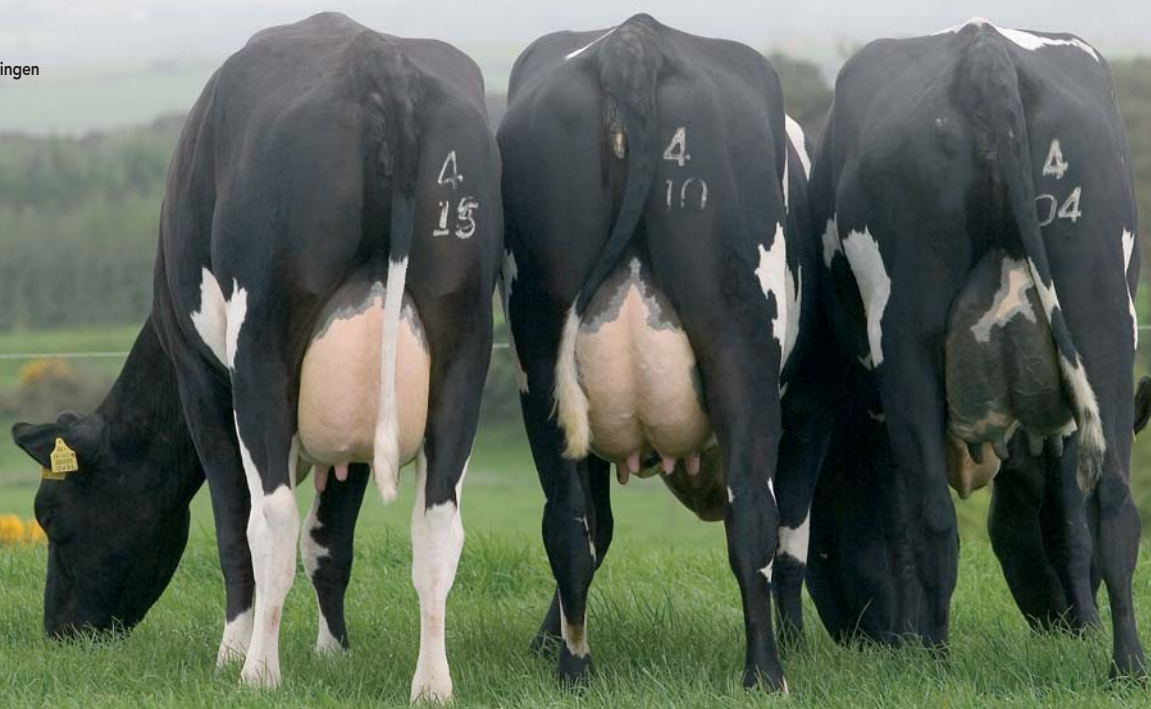
Foto NRF kruislingen in Ierland

Uniek. Dat is Svarstad, een fokstier met een topindex die louter hoornloze dochters krijgt. Wilt u dit kenmerk in uw veestapel fokken zonder toe te geven op economische kenmerken dan is dit uw kans!