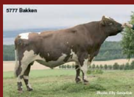
Noors roodbonte stier

100 is gemiddeld in Noorwegen. Noors roodbont geeft heeft ongeveer 5% lagere melkproductie dan Holstein. Het ras heeft kenmerkt door sterk beenwerk en functioneel exterieur. Noorwegen test per stier 300 dochters om zo betrouwbare cijfers te verkrijgen op het gebied van gezondheidskenmerken. Het Noorse testsysteem is wereldwijd uniek, graag informeren wij u hierover.